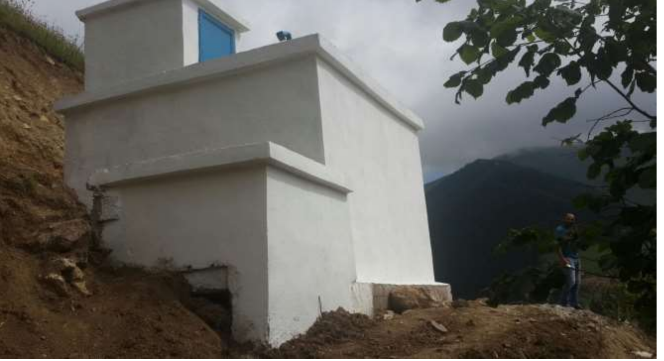
RESİM – 10 KEÇİKAYA İÇMESUYU TESİSATI