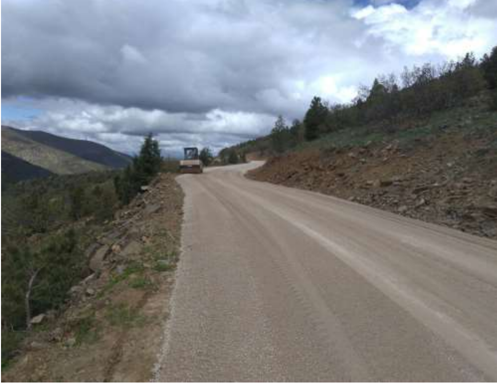
RESİM 4 - MERKEZ SÜLEYMANİYE MAHALLE YOLU