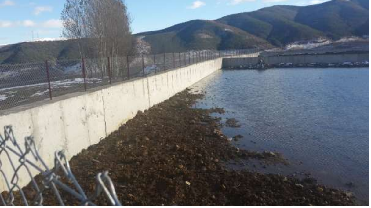
RESİM – 20 ARZULARKABAKÖY SULAMA TESİSİ