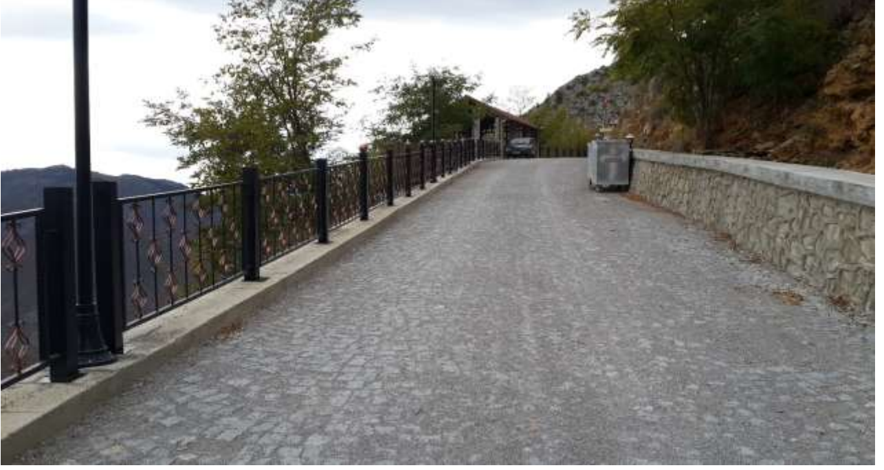
RESİM – 2 KARACA MAĞARASI YOLU BSK YAPIM İŞİ