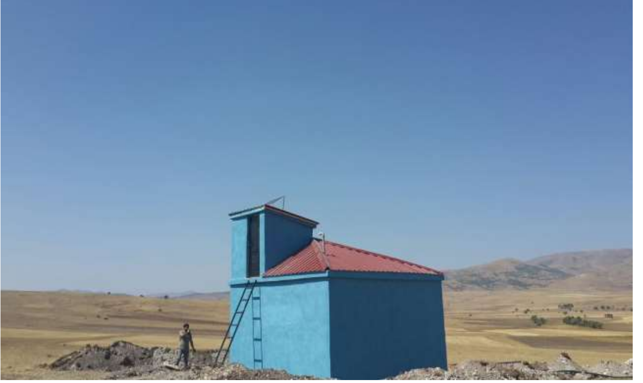
RESİM – 14 GÖKÇEKÖY İÇMESUYU DEPOSU