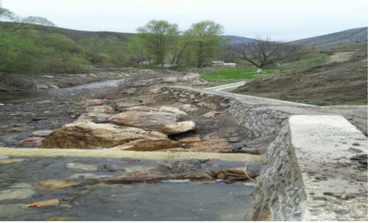
RESİM – 6 TEKKE SULAMA KANALI