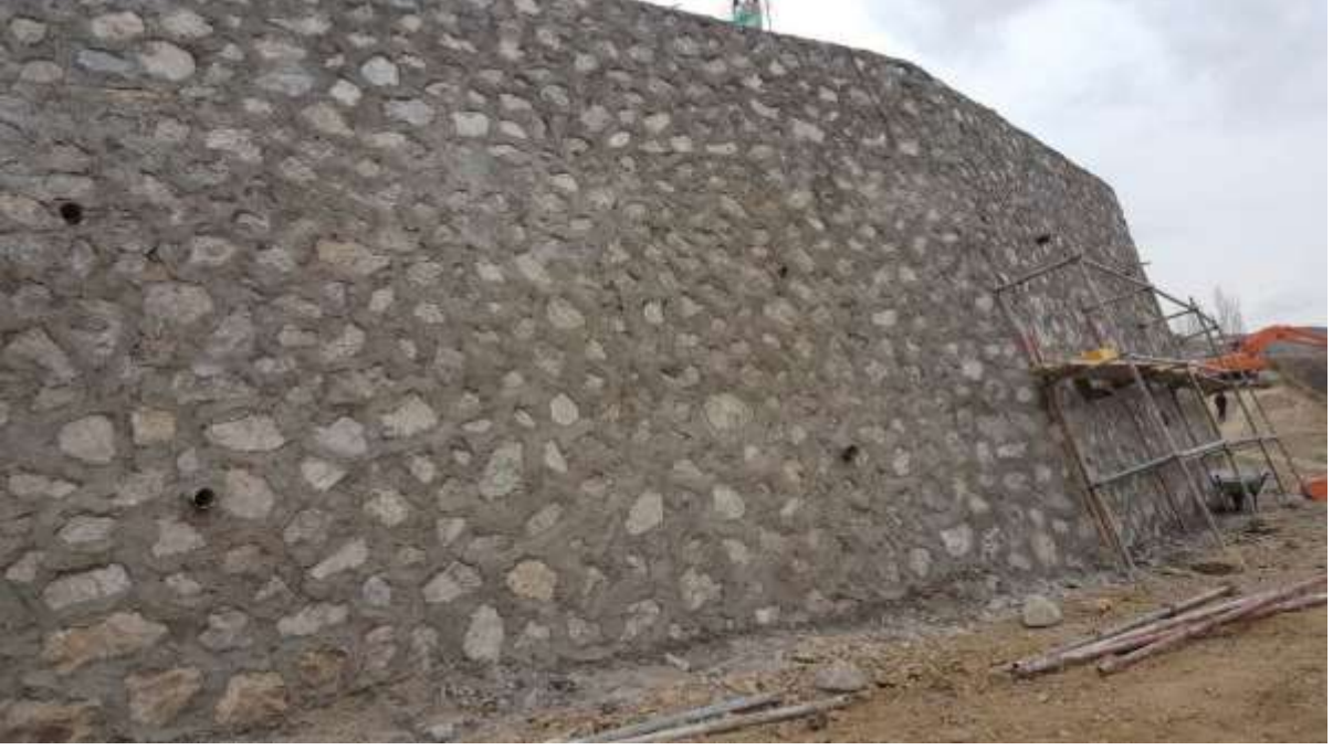
RESİM - 4 ŞİRAN İLÇESİ BALIK HİSAR, BAHÇELİ VE ÇANAKÇI KÖYLERİ KANALİZASYON HATTI