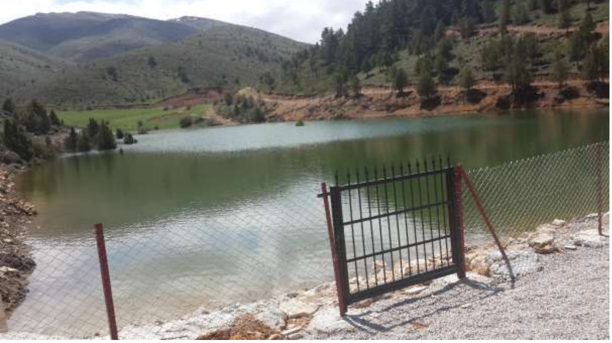
RESİM – 18 KELKİT SADAK GÖLETİ