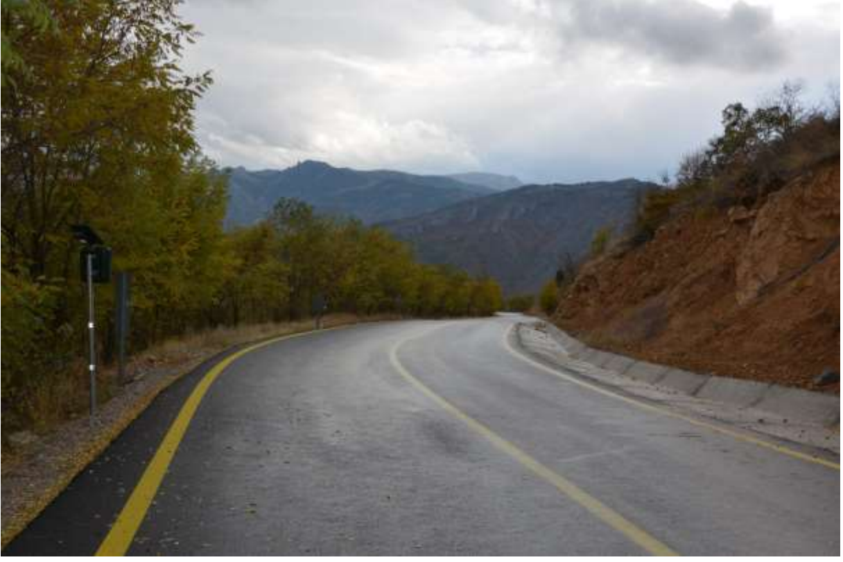
RESİM – 4 ÇAKIRKAYA ŞELELE YOLU BSK YAPIM İŞİ