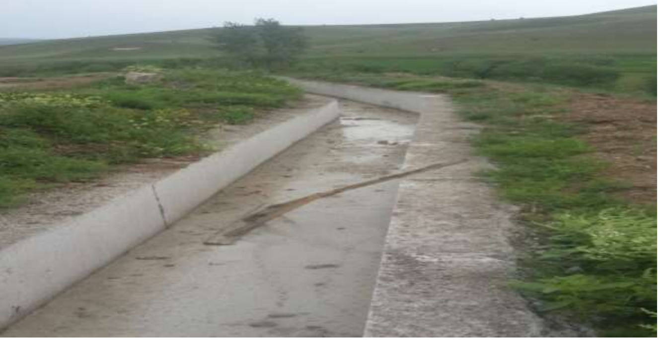
RESİM – 8 KÖSE ÖVÜNCE SULAMA KANALI