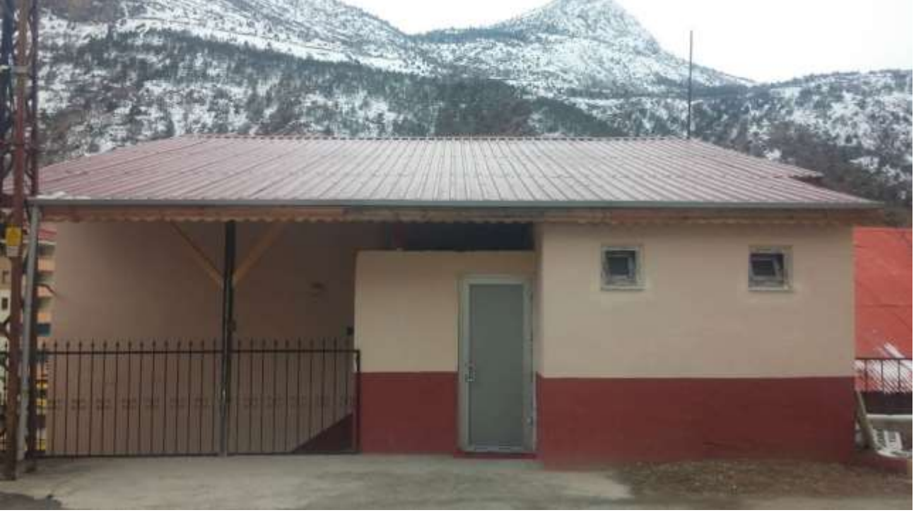
RESİM – 2 GÜMÜŞHANE İL ÖZEL İDARESİ İŞÇİ LOKALI