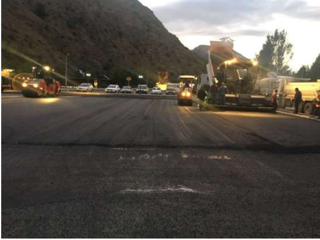
RESİM – 8 ŞİRAN SARICA-ÇAKIRKAYA ŞELELE YOLU