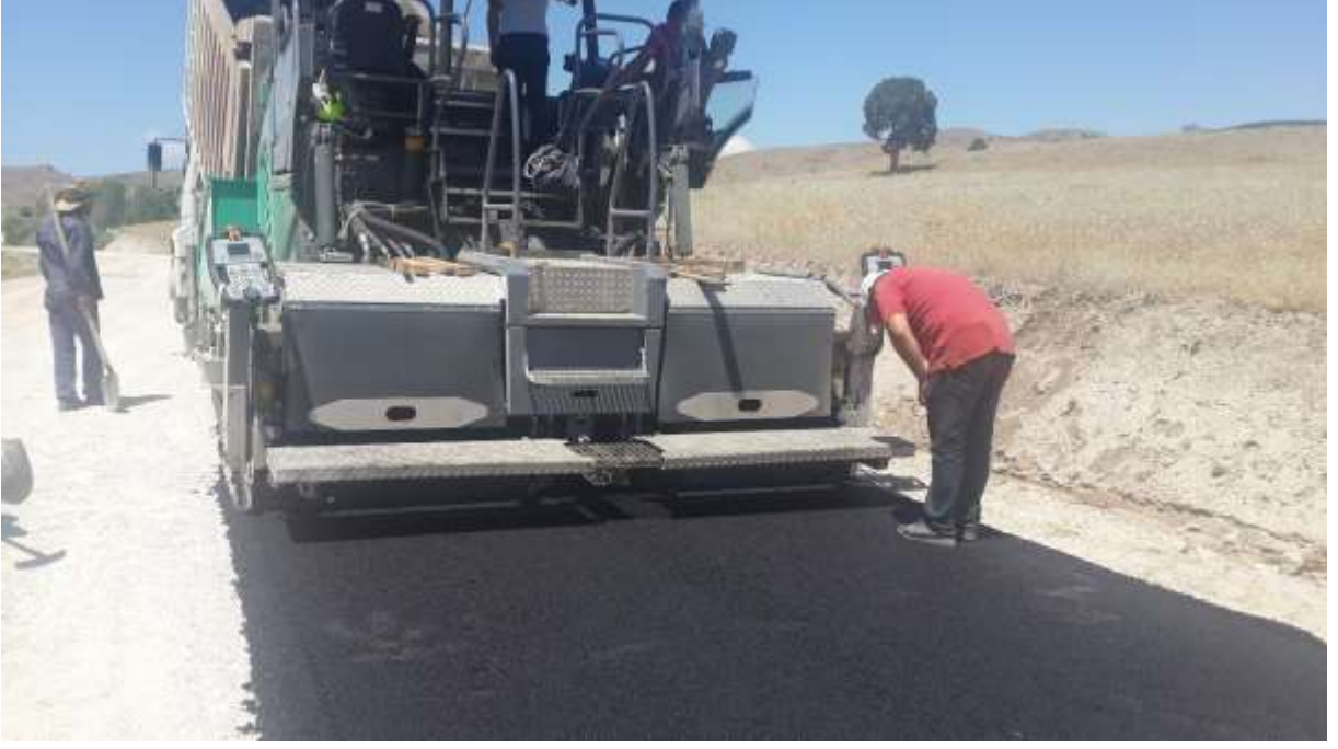
RESİM – 6 CAMİ BOĞAZI YAYLASI PARKE YAPIM İŞİ