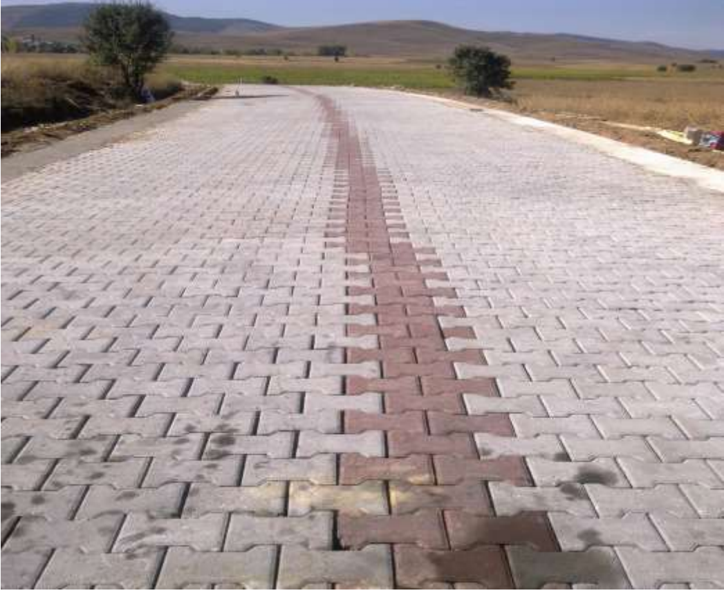
RESİM – 12 TORUL LİMNİ GÖLÜ YOLU