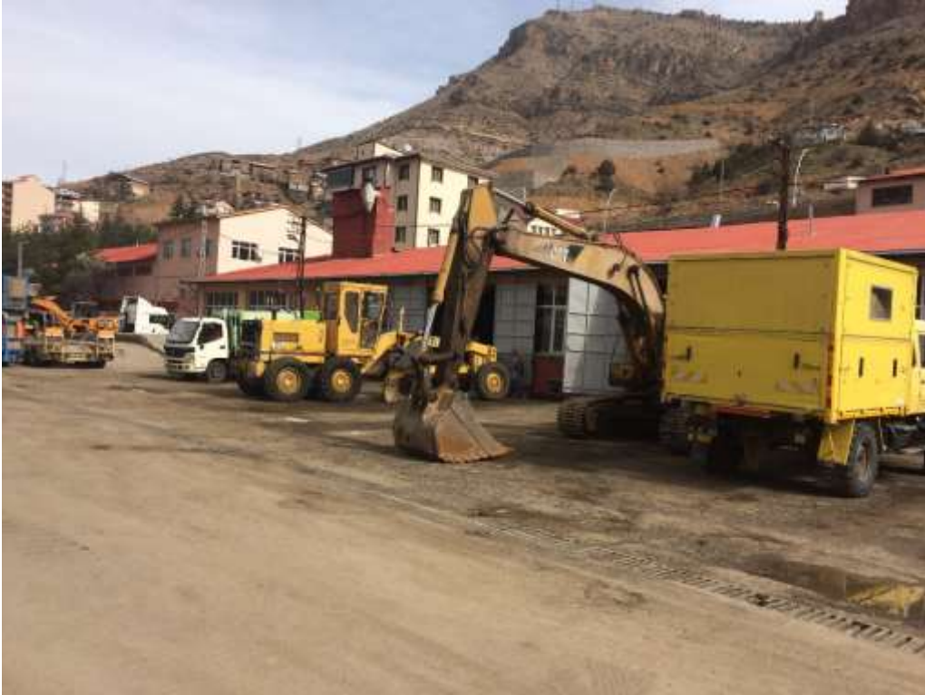
RESİM - 1