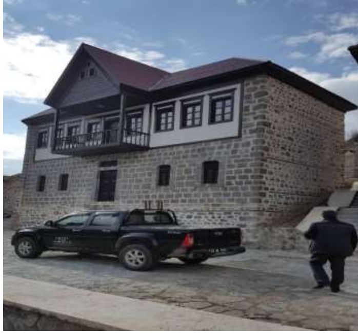
RESİM – 8 KARACA MAĞARASI ÇAY OCAĞI KARACA