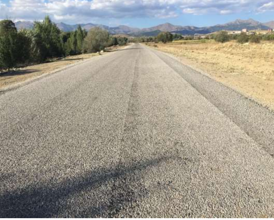
RESİM 2 - GÜMÜŐHANE MERKEZ YENİ HASTANE YOLU