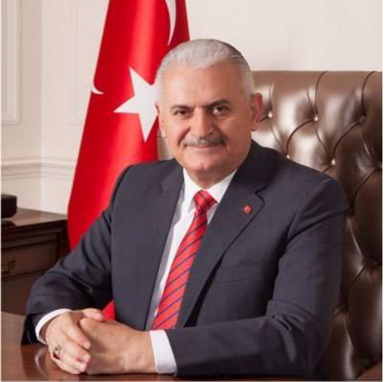
T.C. BAŐBAKANI BİNALİ YILDIRIM